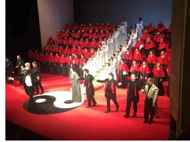
Aplauze la final